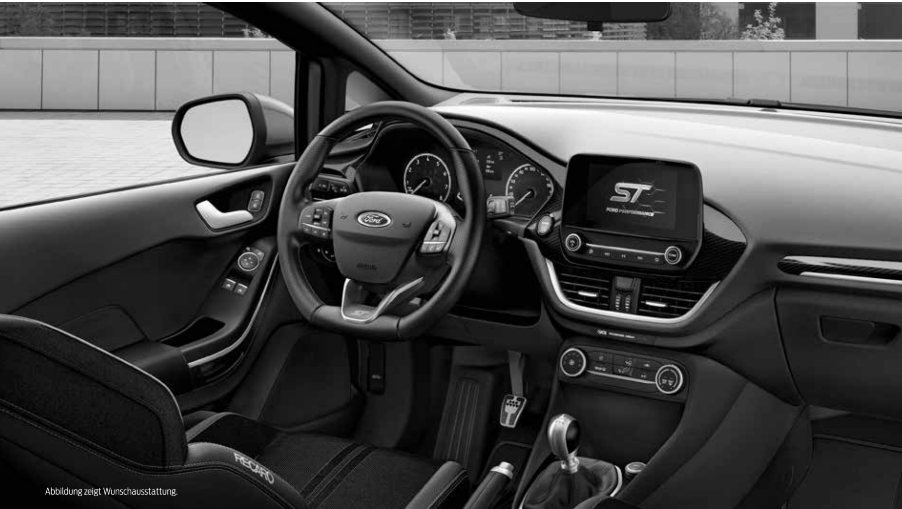
Abbildung zeigt Wunschausstattung.